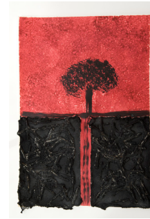
Sense aturar-se 38x56,5 cm