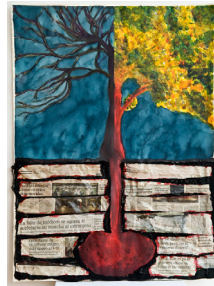
Viure de peu 56,5x76,5 cm