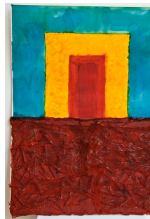
Amb altra mirada 56,5x76,5 cm