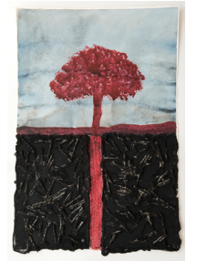
Somnis necessaris 38x56,5 cm