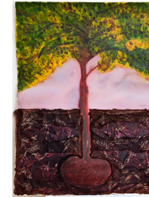
Una altra oportunitat 56,5x76,5 cm