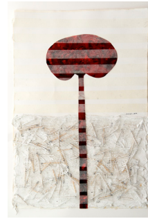
Vulnerabilitat 38x56,5 cm