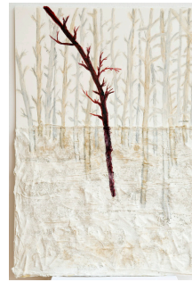
Patiment acompanyat 56,5x76,5 cm