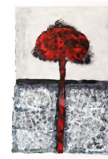
Desig desesperat 38x56,5 cm