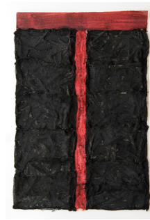
Saturació 38x56,5 cm