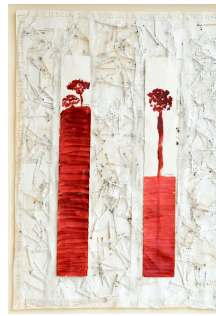
La ciència i la vida 56,5x76,5 cm