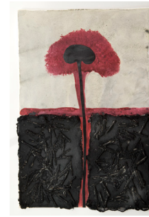
Petrificació 38x56,5 cm