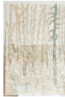
Solitud acompanyada 56,5x76,5 cm