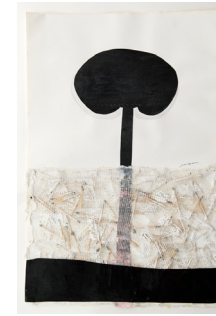
Incredulitat 38x56,5 cm