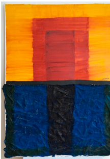
Dia a dia 56,5x76,5 cm