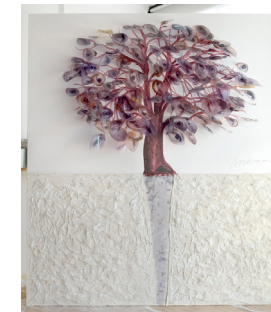
Els que esperen 200x180 cm